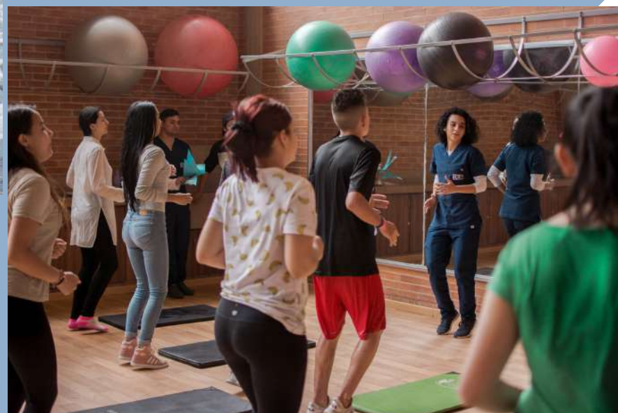
La jornada de inducción de los estudiantes de primer ingreso para el semestre 2018-II se llevó a cabo con total éxito entre el 16 y el 19 de julio.