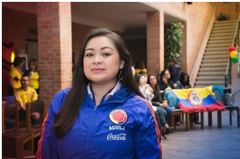
La Copa Mundial de la FIFA 2018 se disfrutó en la ECR