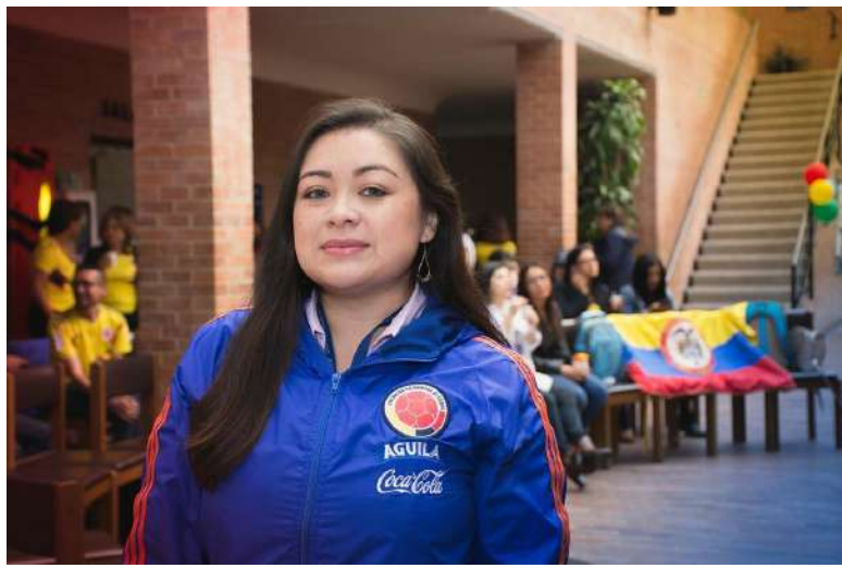
La Copa Mundial de la FIFA 2018 se disfrutó en la ECR