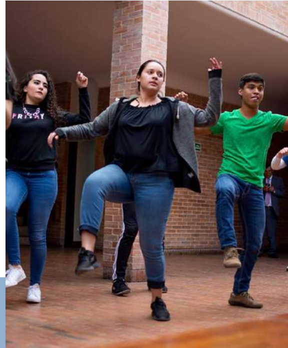
Así se vivió la apertura del XXIII Verano de Investigación Científica y Tecnológica del Pacífico

Aquí un resumen fotográfico de los acontecimientos más destacados del bimestre ocurridos en la ECR