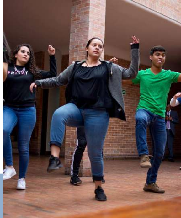
Así se vivió la apertura del XXIII Verano de Investigación Científica y Tecnológica del Pacífico

Aquí un resumen fotográfico de los acontecimientos más destacados del bimestre ocurridos en la ECR