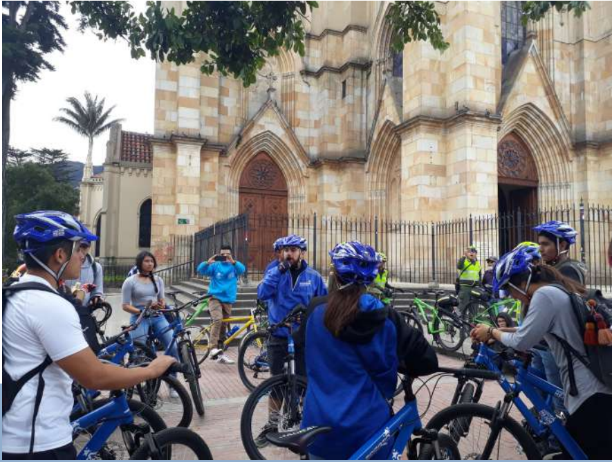
Estudiantes del Programa Delfín disfrutaron de un bicirecorrido literario por Bogotá como parte del Verano de Investigación