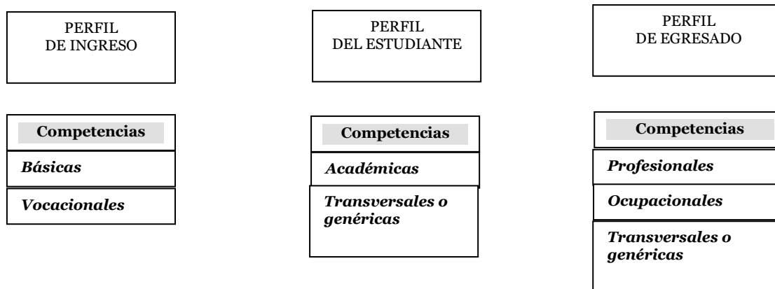
Figura 2. Relación entre perfiles y competencias.